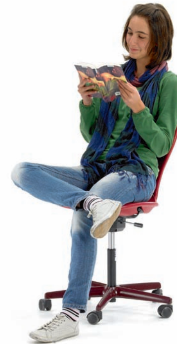
PantoMove-LuPo in vielen verschiedenen Farben