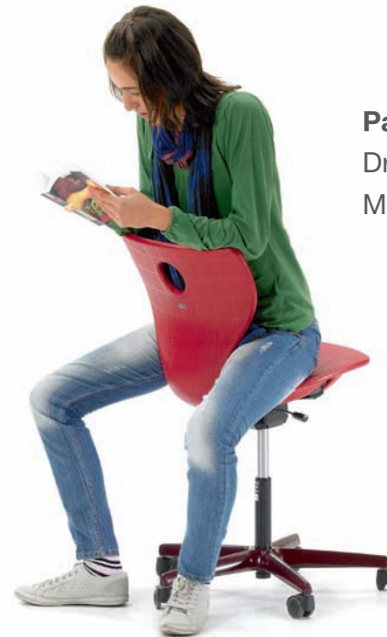
PantoMove-LuPo Drehstuhl höhenverstellbar Mit 3D-Wippe