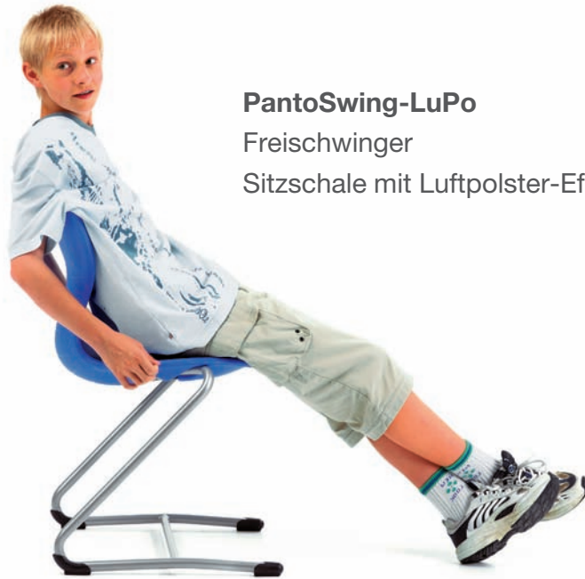
PantoSwing-LuPo Freischwinger Sitzschale mit Luftpolster-Effekt

Dem inhärenten Bedürfnis nach Abwechslung und Bewegung sollte die Bestuhlung Rechnung tragen, indem sie sich den natürlichen und intuitiven Lageveränderungen des Körpers fließend anpasst. Eine frei „fließende“ Sitzfläche folgt ganz selbstverständlich der Gewichtsverlagerung in allen Richtungen. Die Formgebung der Sitzschale regt zu alternativen Sitzhaltungen (Reitersitz) an.